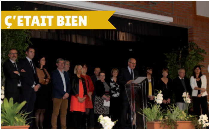
Cérémonie d'échange de vœux le samedi 11 janvier