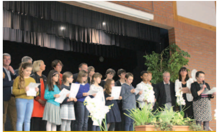
Le Conseil Municipal des Enfants à la cérémonie d'échange de vœux