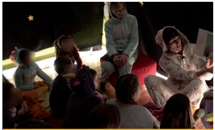
Nuit de la lecture le samedi 18 janvier : heure du conte en pyjama !