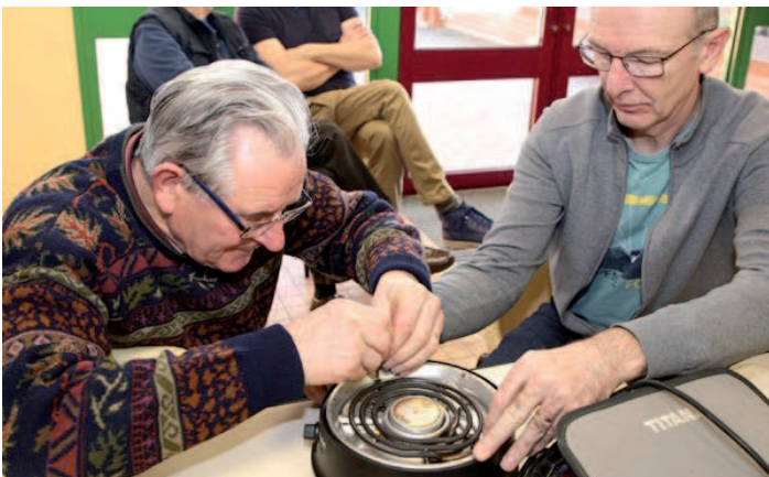
Nuit de la lecture le samedi 18 janvier : premier repair'café