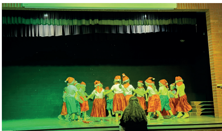
Arbre de Noël du 12 décembre - GS