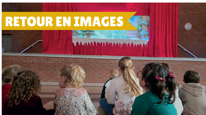
Spectacle de marionnettes par le théâtre Mariska le 6 décembre