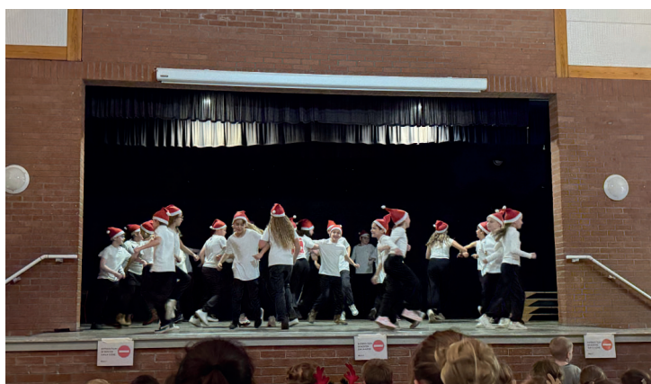
Arbre de Noël du 12 décembre - CM2