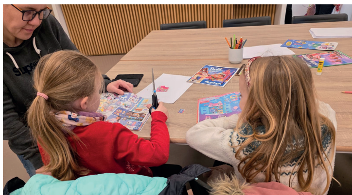
Atelier de création de la lettre au Père Noël le 6 décembre