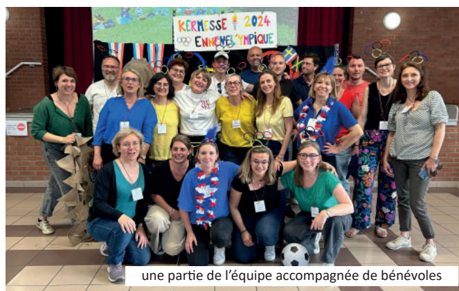
une partie de l'équipe accompagnée de bénévoles