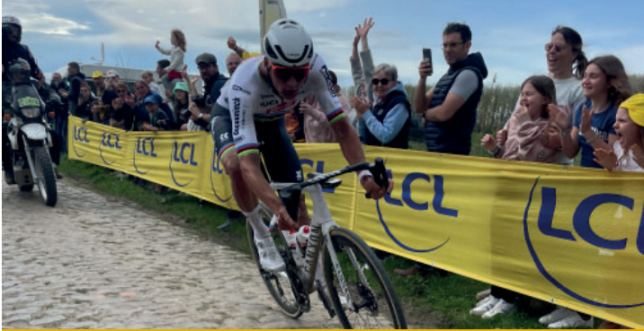
Paris Roubaix dimanche 7 avril