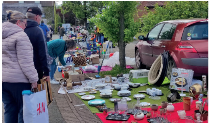
Marché aux puces samedi 20 avril