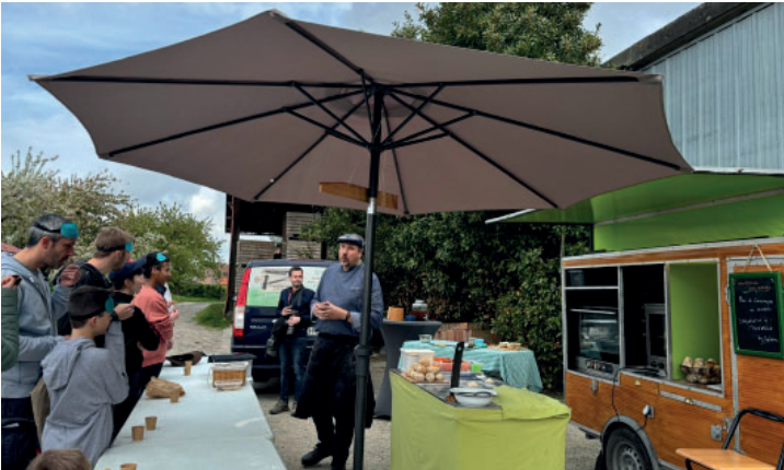
« les médiathèques vous régalent » dimanche 14 avril