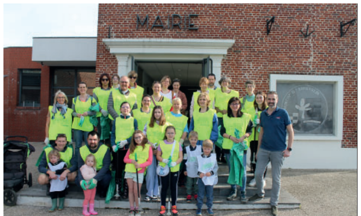
Opération « village propre » samedi 13 avril