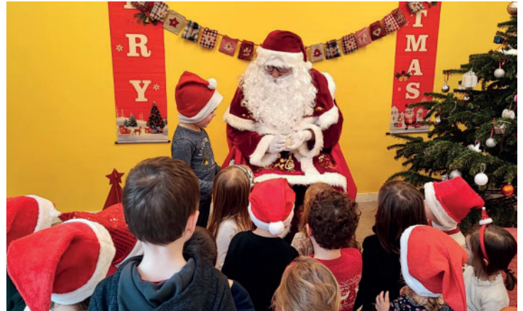
Passage du Père Noël dans toutes les classes pour la distribution de coquilles le vendredi 22 décembre