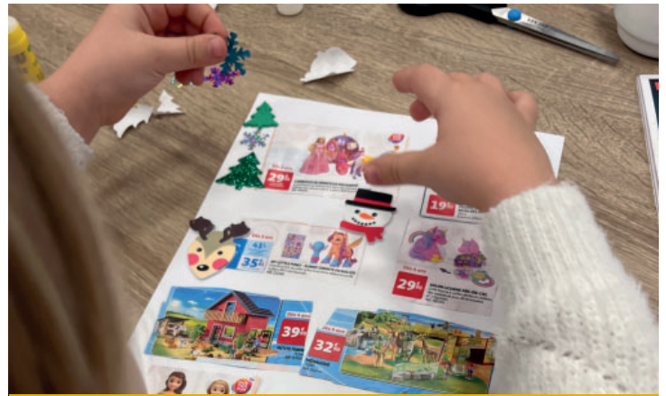
Noël à Ennevelin le 2 décembre : création de la lettre au Père Noël