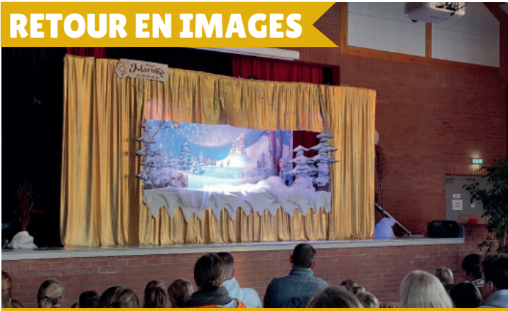
Noël à Ennevelin le 2 décembre : spectacle de marionnettes