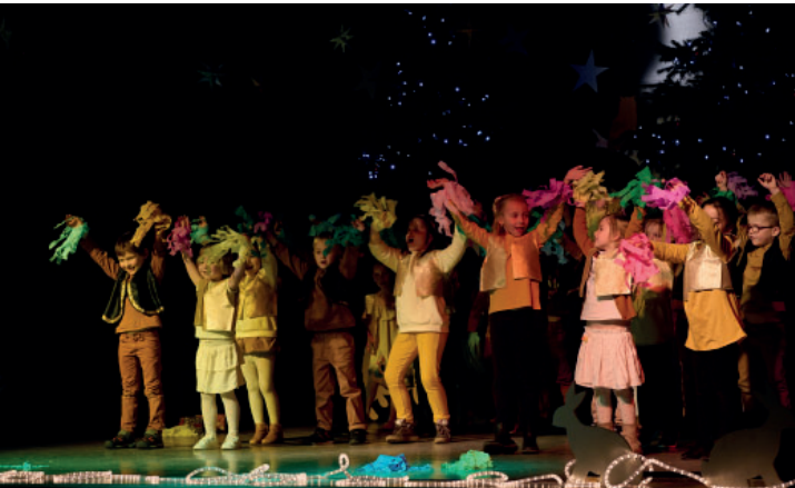
Arbre de Noël de l'école Daniel Devendeville le 16 décembre sur le thème «Noël au pays des contes de fées»