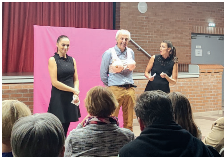
Octobre Rose : spectacle «les dépisteuses» le samedi 14 octobre