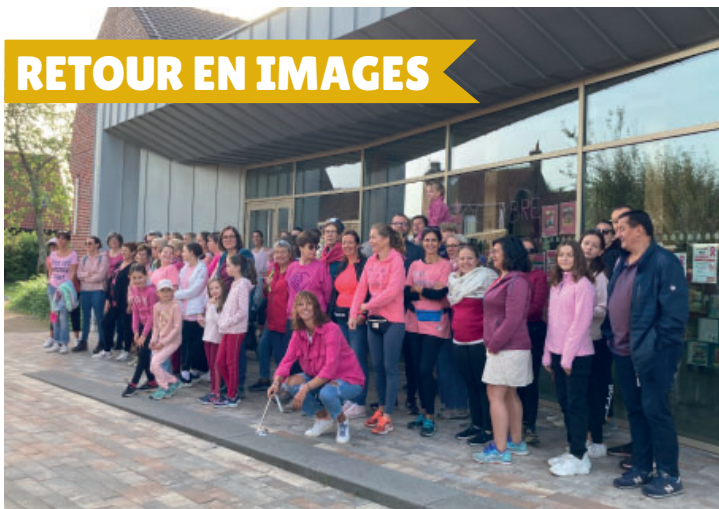
Octobre Rose : marche rose le dimanche 8 octobre