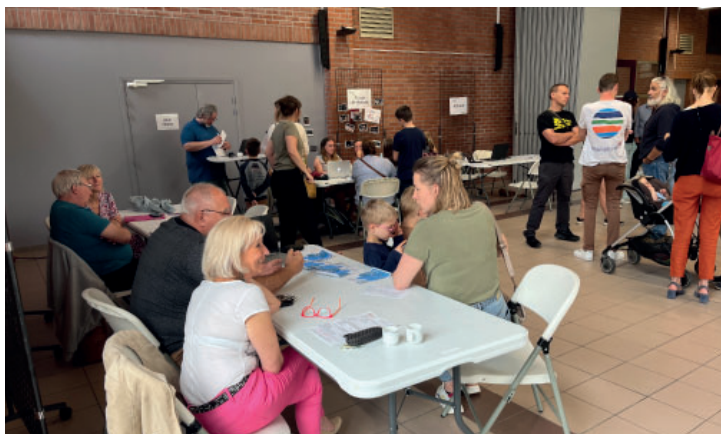
Forum des associations le 1 er juillet