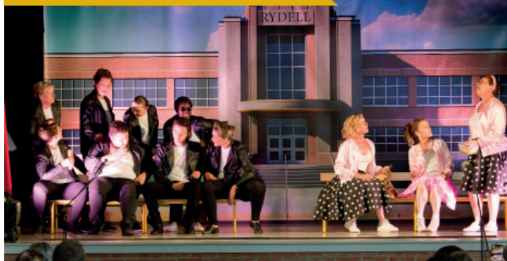
Comédie musicale «Grease» par mélimedance le 21 juin