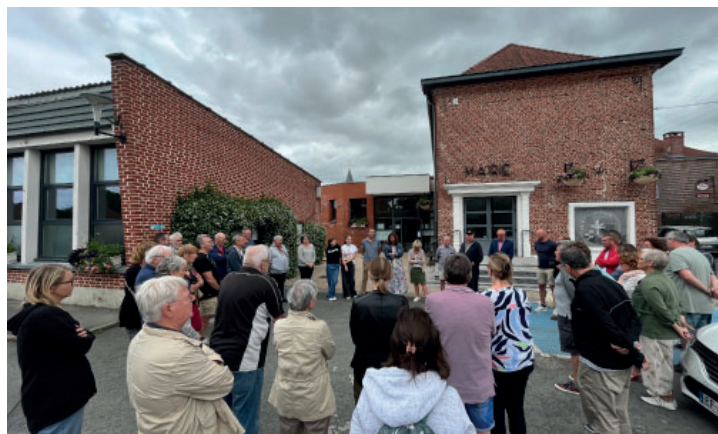
rassemblement citoyen : 42 personnes présentes le 3 juillet devant la mairie, lecture du courrier de l'AMF puis chant de La Marseillaise.