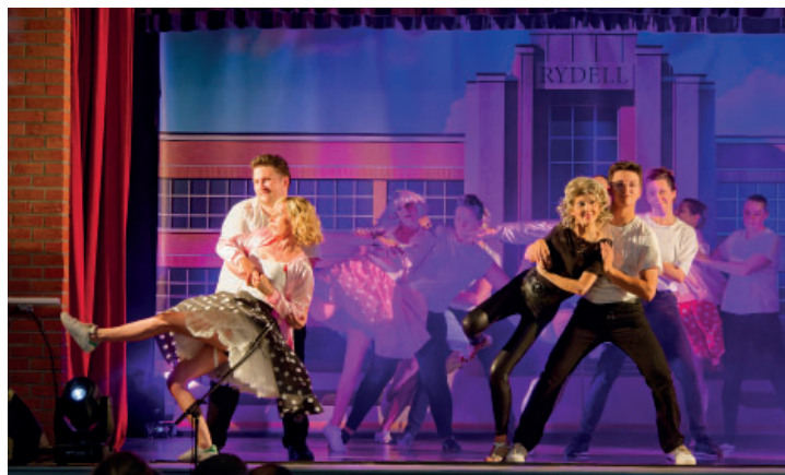
Comédie musicale «Grease» par mélimedance le 21 juin