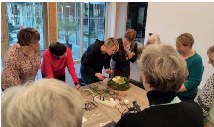
Atelier seniors à la Marque Page le 12 décembre 2022