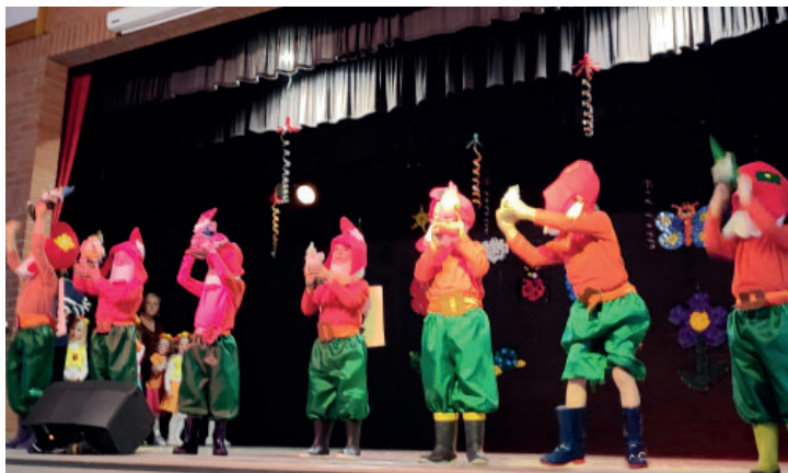
Arbre de Noël de l'école le vendredi 9 décembre 2022