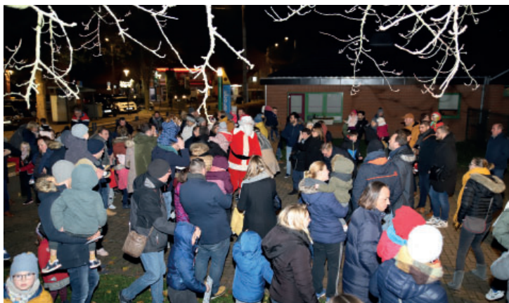
Noël à Ennevelin avec la visite du Père Noël le 3 décembre