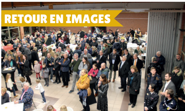
Nouvelle formule des voeux le samedi 3 décembre 2022